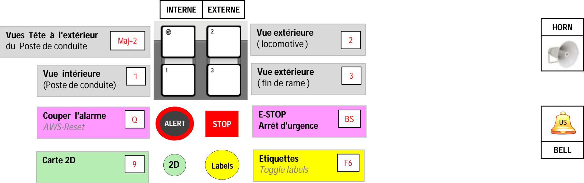
Train Simulateur 2012 (RailWorks 3)